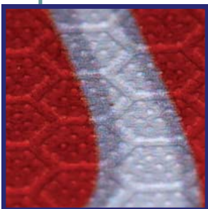
Hexagon Prägung nach dem Druck

Die geprägte Struktur weist pro Hexagon 19 kleine Punkte auf, die gegenüber dem Rest der Fläche erhaben sind. Diese Punkte haben beim Darüber laufen Kontakt und nutzen mit der Zeit ab. Hierdurch entstehen dann sehr kleine weiße Punkte im Druckbild. Gleichzeitig wird der Rest