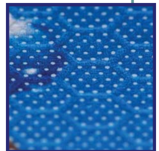
Abgenutzte Spitzen der Hexagon Prägung

Eine Werbebotschaft kann für bis zu 6 Monate im Innenbereich genutzt werden - je nach Belastung.